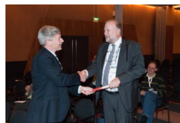
Oude en nieuwe voorzitter